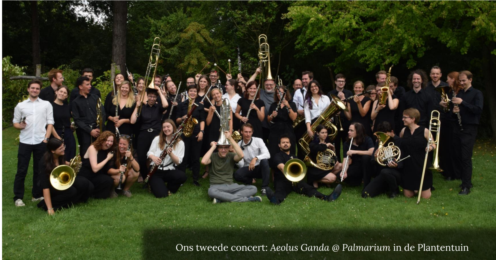
Ons tweede concert: Aeolus Ganda @ Palmarium in de Plantentuin